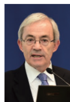
Christopher A. Pissarides 英国伦敦政治经济学院王室讲席教授 2010年诺贝尔经济学奖得主