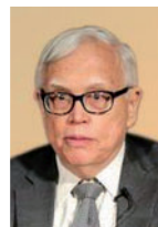
James Heckman 美国芝加哥大学教授 2000年诺贝尔经济学奖获得者