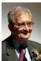
Amartya Sen 美国哈佛大学教授 1998年诺贝尔经济学奖得主